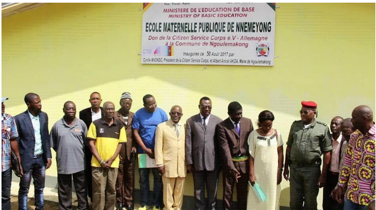
Photo de groupe des officiels lors de la cérémonie

L'ONG de la Diaspora Camerounaise de droit Allemand, Citizen Service Corps e.V. (CSC e.V.) offre une salle de classe à l'école maternelle de Nnemeyong par Ngoulémakong comme don.